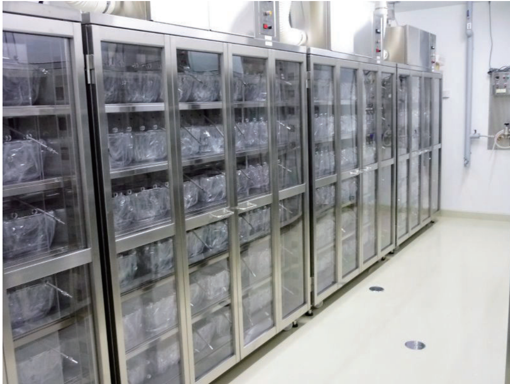
室内エア 排気ダクト接続