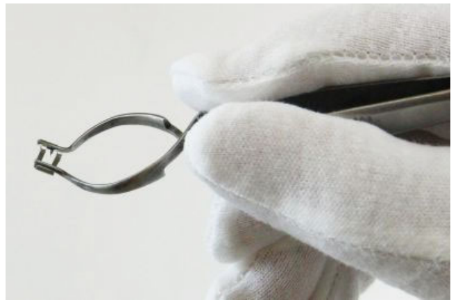
④ リムーバーを持ち上げれば、クリップは除去されます。