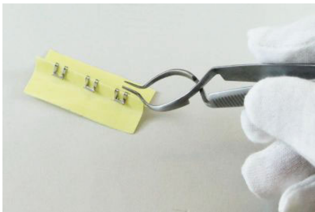
① 縫合クリップの凸部にリムーバー先端部を添わせて下にさげます。