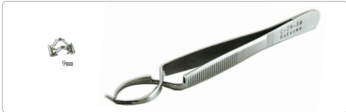
使用前の縫合クリップ(鋏)