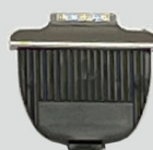
E-22-CC-B20N 20 mm

動物実験では従来ヒト用・ペット用のバリカンが汎用されていますが、C-Clipperは“短く刈れて、皮膚を傷つけにくい”実験動物専用の替刃です。