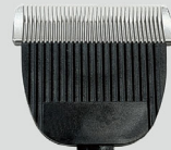
E-22-CC-B42N 42 mm