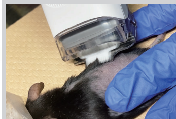
ラット毛刈り中 (替刃 20 mm)